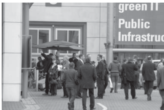
green IT in der public infrastructure? Ja von wegen! Aber möglich wär's schon.

Vielleicht sind die Verhältnisse so, weil wir uns zu wenig dafür interessieren, zu wenig darüber wissen und keine Vorstellung haben, wie sie zu ändern wären. Dabei sind wir Verbraucher in den Industriestaaten bei der Kaufentscheidung nicht ohnmächtig. Nichtregierungsorganisationen aus mehreren Ländern klären auf und geben Anregungen, was zu tun ist. In Deutschland sind es WEED und Germanwatch. Ein Beitrag in dieser FifF-Kommunikation soll einen ersten Überblick geben, und auf der Jahrestagung wollen wir uns ausführlicher mit dem Thema beschäftigen. Es wird um Herstellung, Beschaffung, Betrieb und Entsorgung der Geräte gehen, mit vielen interessanten Informationen. Was uns besonders wichtig ist: Es gibt Handlungsmöglichkeiten, und vielleicht können auch die Teilnehmer/-innen der AG neue Anregungen beisteuern.